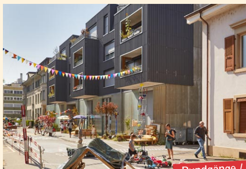
Rundgänge / Visites guidées