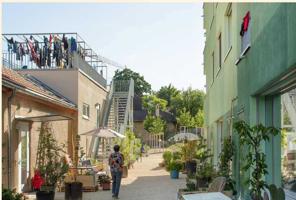
La coopérative d'en face, Neuchâtel, 2020, Photo © Yves André